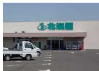
北海道 約360m(徒歩約6分)