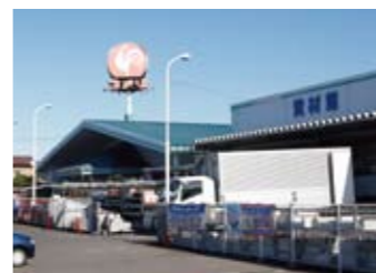
コメリ 約600m(徒歩約11分)