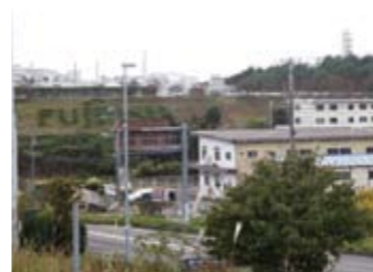
工業団地 約2000m(徒歩約36分)