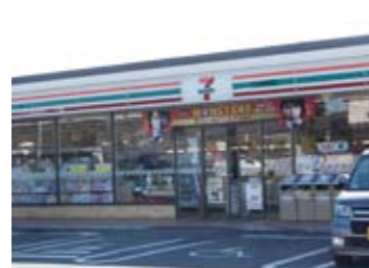
セブンイレブン 約800m(徒歩約15分)