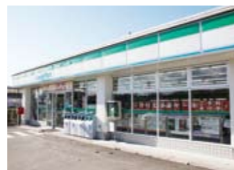
ファミリーマート 約260m(徒歩約5分)