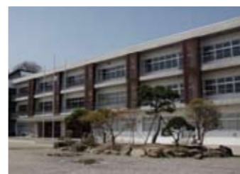
村田第一小学校 約1500m(徒歩約27分)